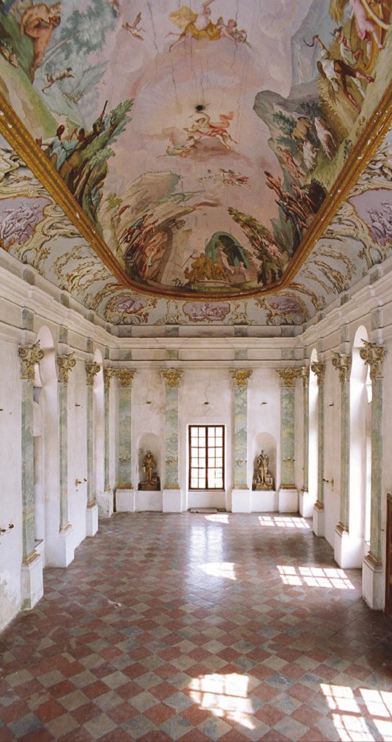
Festsaal des Klosters „Aula Maior“, genannt „Der Steinernen Saal“, 1764/65