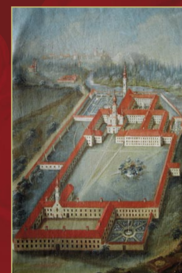
Idealdarstellung um 1792

1982 begann die fünf Jahre dauernde Gesamtrestaurierung der Klosterkirche, die seit dieser Zeit in neuem Glanz schöner denn je erstrahlt.