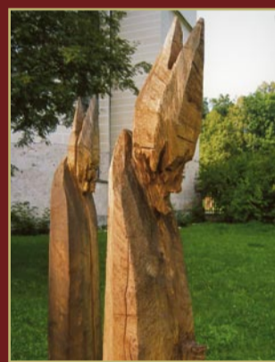
Kunstwerk im Klostersgarten „Die Stellvertreter“

Raitenhaslach war schon mehrmals Drehort von Fernsehserien.