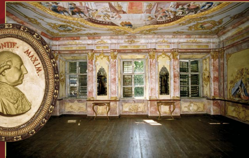
Papstzimmer im Prälatenstock, beherbergte Papst Pius VI. im Jahre 1782